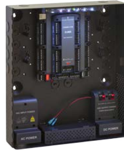
AC-825IP Avanzada Plataforma de Acceso de Red Escalable