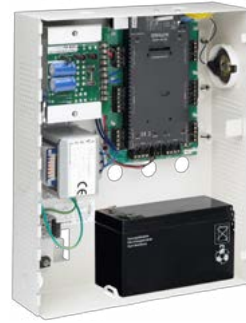
AC-225/IP Avanzado Controlador de Acceso en Red Escalable