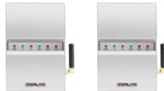
MD-W11N/F/BP Unidad Inalámbrica con Interface para Control de Acceso de Puertas