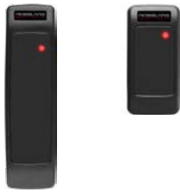
AY-L23 Lector RF de Extra Largo Alcance y AY-KR12B