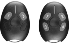
SA-23-B2/B4 Transmisor para Lector AY-L23