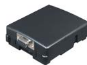
Convertidor MD-81 RS232 para Wiegand de 26 bits de salida