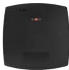
AY-Z12A Lector de Proximidad de Largo Alcance para Exterior