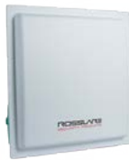
AY-U910 Lector UHF de Largo Alcance Integrado